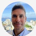
Hugo Castilho Robótica